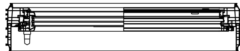
Übersicht Therm 3.0 Standard Dreh/Kipp AT