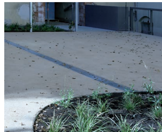
Innenhofentwässerung mittels ACO Multiline Entwässerungsrinnen