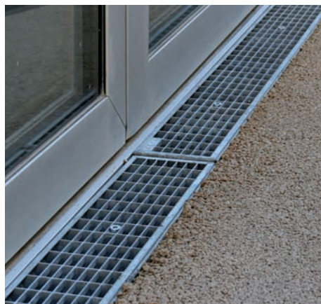
Detailansicht ACO E100K Fassadenentwässerungsrinne im Türbereich