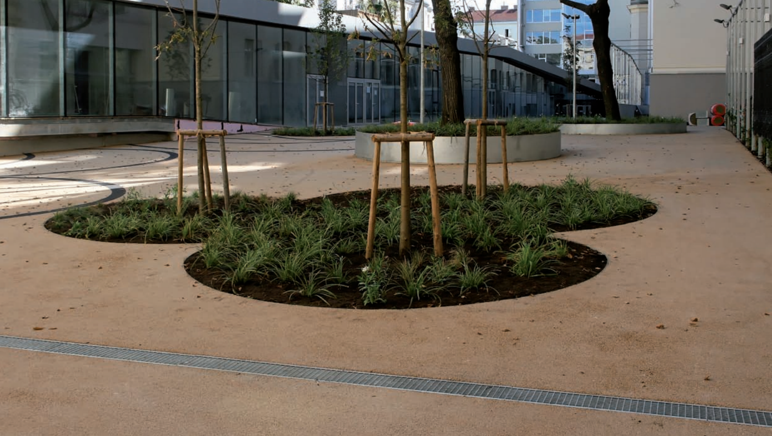
Innenhof, künstlerisch gestaltet mit Grüninseln und Ornamenten