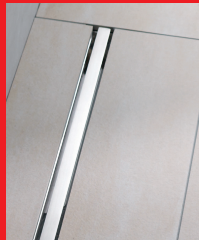
Beeindruckende Ablaufleistung von bis zu 0,8 l/s