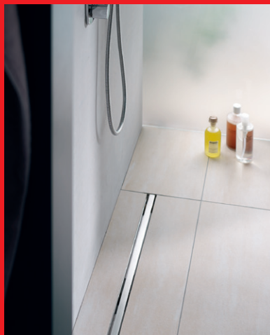
Minimale Einbautiefe von 55 mm