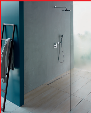
Schmales Schmuckstück von nur 2 cm Breite