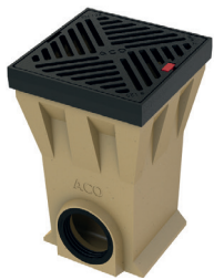
Hofablauf aus Polymerbeton mit Gussrost und -zarge (EN-GJS)

Die Abdeckung kann nur unter Zuhilfenahme eines Werkzeuges geöffnet werden und eignet sich hervorragend für den Einsatz in öffentlichen Bereichen, wie z.B. Schulhöfen, Fußgängerzonen oder Bahnsteigen, aber auch im privaten Bereich als Terrassentwässerung. Zum Anschluss an eine Rohrversickerung ist ein Filtersack erhältlich. So wird das Wasser gereinigt in die Versickerung geführt.