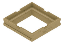
Ausgleichselement aus Polymerbeton zur Anpassung der Bauhöhe an Oberflächenbelag