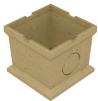
Aufsatzkasten aus Polymerbeton zur Aufstockung der Bauhöhe, mit Vorformung DN/OD 110 für Fallrohranschluss