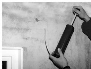
4. Bohrlöcher reinigen.