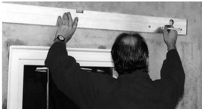
2. Die Lage des Lichtschachtes bestimmen (Oberkante Lichtschacht, Mitte Fenster) und mit der Montagehilfe für Lichtschächte die beiden obersten Löcher anzeichnen. (OK Montagehilfe = OK Lichtschacht) Den Lichtschacht anhalten und die Kontur grob mit dem Bleistift markieren.

Der Abstand von der Fensterunterkante bis zum Lichtschachtboden muss \geq 15 cm (gem. DIN 18195) betragen.