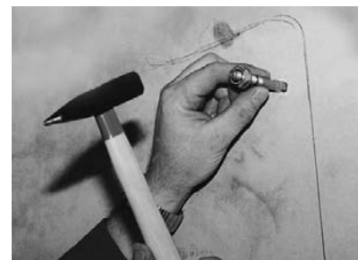
5. Die beiden oberen Schwerlastdübel einschlagen.