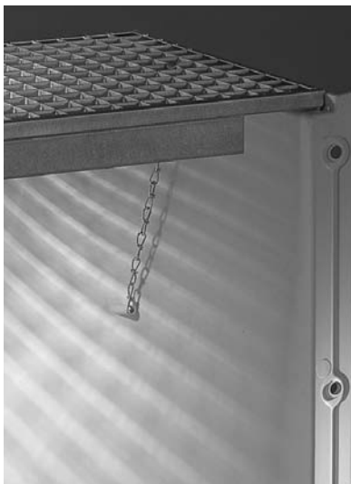
1. Lichtschachtrost einsetzen und Rostabhebesicherung einbauen.