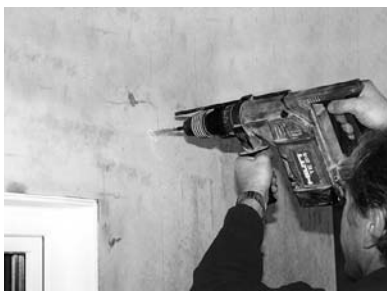
3. Die beiden obersten Löcher mit Tiefenanschlag (7 cm) bohren. Achtung: nicht zu tief bohren!

Wenn keine Wasserwaage zur Verfügung steht, halten Sie den Lichtschacht mit eingelegtem Rost an die Wand und kennzeichnen die Position der beiden oberen Bohrungen.