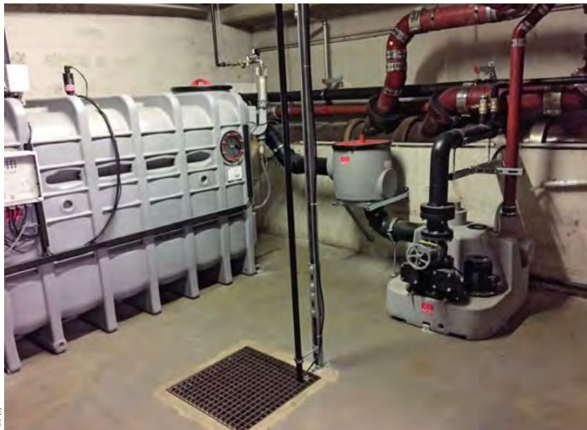
Der Fettscheider ACO LipuJet-P-OA mit einer nachgeschalteten Hebeanlage ACO Muli Star.