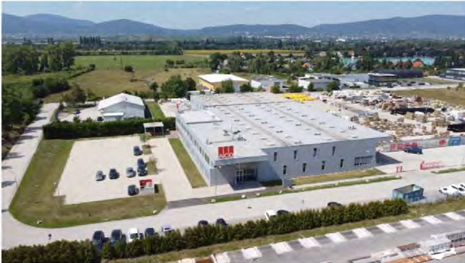
Der ACO-Firmensitz in Baden bei Wien.

Der Entwässerungsspezialist ACO Passavant mit Sitz im deutschen Philippsthal kauft die Konkurrenten im Bereich gewerbliche Küchen per Jahresende.