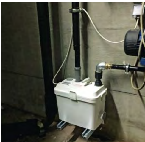
Die Hebeanlage ACO Sinkamat KD.

Sehr fetthaltiges Abwasser gefährdet Rohrleitungen und Entwässerungsgegenstände. Fette und Öle lagern sich gemeinsam mit anderen Abwasserbestandteilen an den