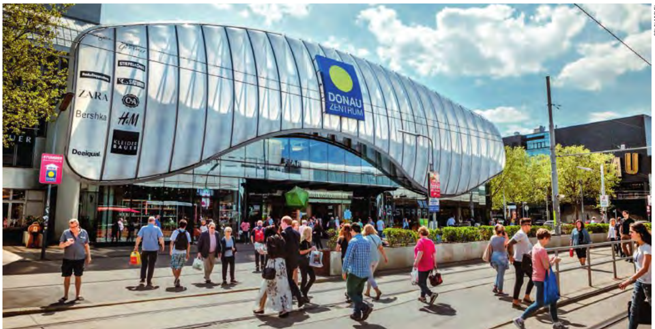
Das Donauzentrum von außen.

Das im 22. Wiener Gemeindebezirk gelegene Donau Zentrum wurde im Jahre 1975 eröffnet und erlangte schon in den ersten Jahren überregionale Bedeutung. Im Laufe der Zeit wurde das Einkaufszentrum mehrmals erweitert und 2010 komplett modernisiert.