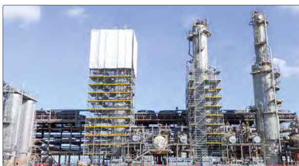
Wie im Geschäftsfeld Schalung will Doka auch beim Gerüst »durchdachte Lösungen und Services« anbieten.

Als Teil der Aco Gruppe übernimmt die AcoPassavant GmbH mit Sitz im deutschen