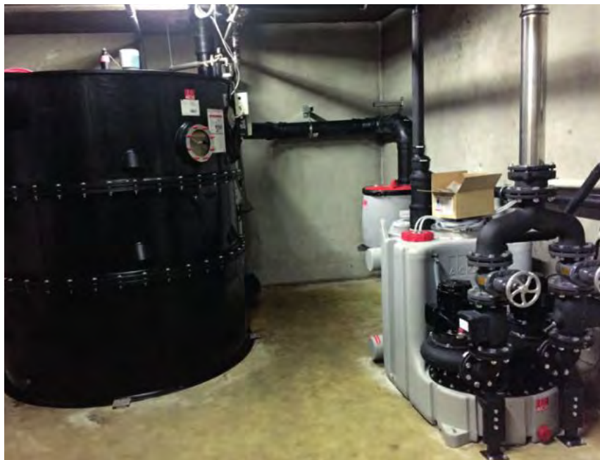
Der Fettscheider ACO LipuJet-P-RA mit nachgeschalteter Hebeanlage ACO Muli Pro PE K.