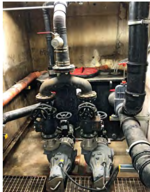
Die Muli PRO PE N-XL zur Entwässerung im Ladehof.

Wänden der Rohre ab und können zu Korrosion, Verstopfungen und Geruchsbelastigungen führen. „Fetthaltiges Abwasser gefährdet Rohrleitungen & Entwässerungsgegenstände. Darum ist in jeder gewerblichen Küche ein Fettscheider gesetz-